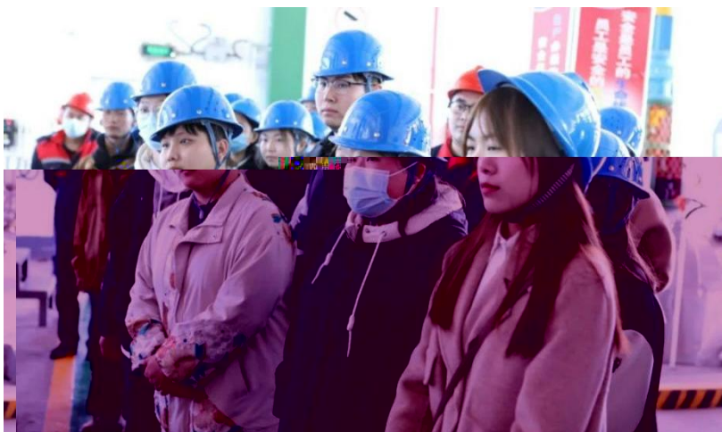
5 到企业 位 习

“借 ， 为 。” “ ” ， “ ” 以 ， 企 严 ， 共 人 养 ， 利 人 养任务， 个 中 全体 优 ， 专业 、 上佳 。 到 业之 ， 公 ， 公 企 ， 企业 产一 位 习， 习中 们 公 个 位 ， 一 了 业 力 ， 为了 公 中 。